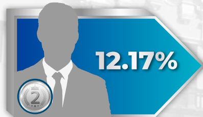
Candidato de Renovación Popular