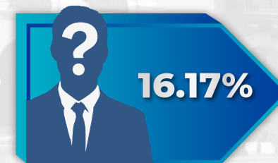
No sabe/No opina